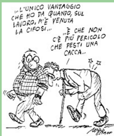
Ridiamo? Edizione AMNIL INAIL

Un'attenzione particolare è stata rivolta anche ai rischi connessi alla movimentazione manuale dei carichi, postura e ergonomia, dedicando una sezione della mostra al tema della settimana europea "Alleggerisci il carico".